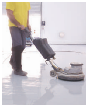
Starke Verschmutzungen bearbeiten

Anschließend wird der gewaschene Boden mit der Scheibenmaschine gereinigt und dabei darauf geachtet, dass die Reinigungslösung nicht antrocknet. Wir befreien auch unzugängliche Bereiche sorgfältig von Schmutz- und Pflegefilmresten.